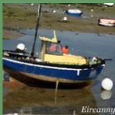
A la manière de.....