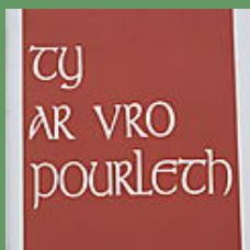
Balade en pays Pourleth (noir et sépia)