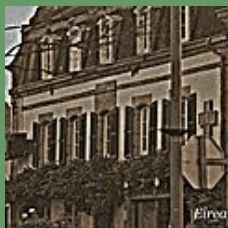
BANNALEC / Notre-Dame du Folgoët

Nous les retrouvons dans le miroir huit, là les dialogues sont plus étoffés, comme dans une tragédie antique.