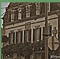
BANNALEC / Notre-Dame du Folgoët

Pour une fois je vais me permettre de surtout faire un florilège de phrases que j'ai aimées tout au long de ma lecture qui, me semble-t-il, reflétera le mieux possible la nature de cette écriture navigant loin des sentiers battus et rebattus.