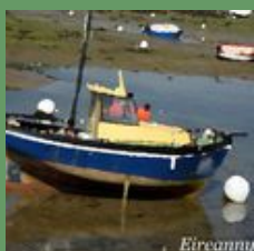
A la manière de.....