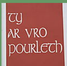
Balade en pays Pourleth (noir et sépia)