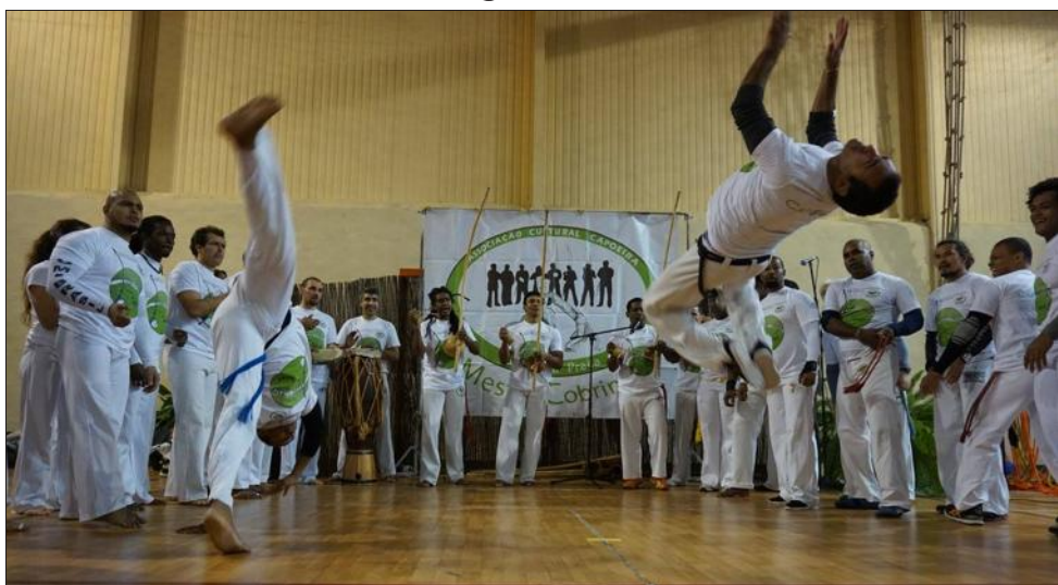
Les cours de capoeira ont repris avec l'association culturelle capoeira d'Avignon, que mestre Cobrinha a créée il y a dix ans.

La capoeira, art martial brésilien, est une discipline complè-