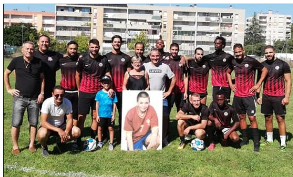
L'équipe de l'US Avignon.