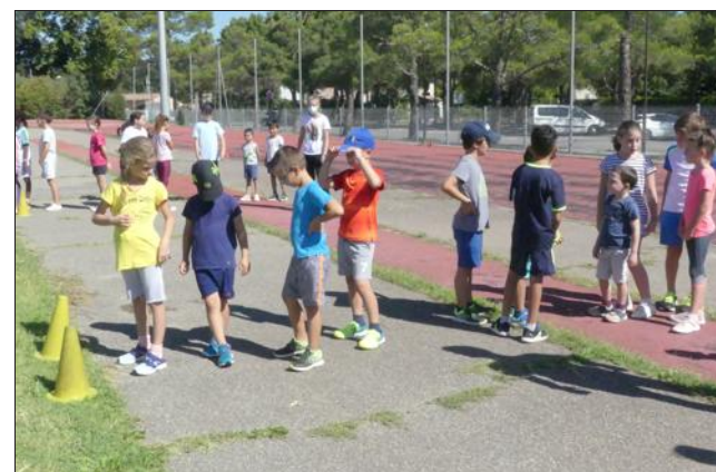
Préparation physique ce samedi matin.

Même si la journée portes ouvertes qui était prévue samedi dernier a été annulée à cause de la crise sanitaire, la saison a bien repris au club sportif Avignon Montfavet athlétisme (CSAMA). Samedi matin, petits et grands étaient déjà en pleine préparation physique sur le stade de la Martelle à Montfavet pour faire découvrir le club à ceux qui hésitent à prendre une licence pour l'année -deux essais gratuits sont proposés.